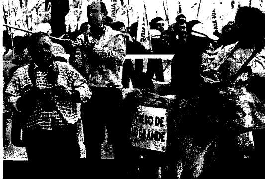
MARCHA. Transcurrió en medio de un ambiente festivo.

A esa idea se sumaron los alcaldes de Coín, Alhaurín el Grande, Cártama, Pizarra, Guaro y Tolox, quienes estuvieron presentes en la cabecera, acompañados