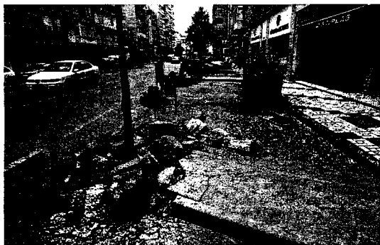
LA ZONA. Habrá un carril de servicio para los vecinos.

Por la calle Héroe de Sostoa circularán cada día 26.000 vehículos, según los estudios de tráfico elaborados al hilo del proyecto del